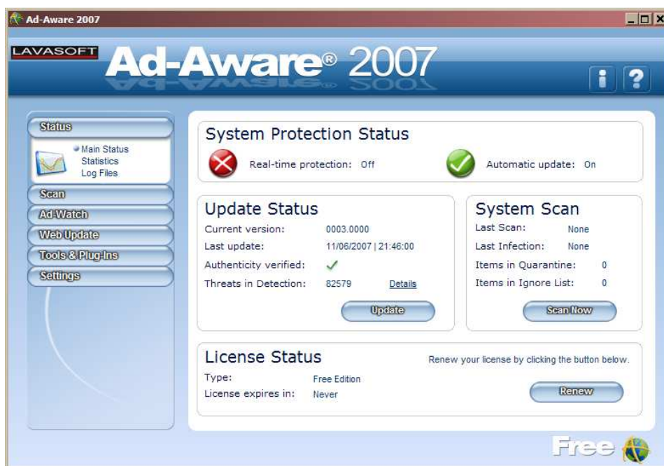
• Startscreen van Ad-Aware 2007

Ad-Aware is een programma dat spyware verwijdert van Uw PC. Gezien dit programma op een andere wijze de PC scant dan bv. Spybot kan dit programma complementair gebruikt worden naast Spybot. U gebruikt dit best na een lange surfsessie. Deze versie werkt NIET meer op onder Windows 98/ME