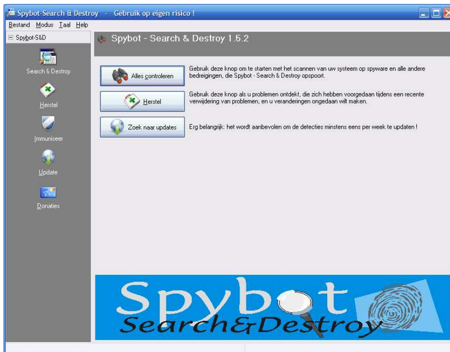
• Startscherm van Spybot 1.5.2

Spybot-Search & Destroy is net zoals Ad-Aware een programma dat spyware verwijdert van Uw PC. Dit kan naast Ad-Aware 2007 gebruikt worden. Deze versie werkt nog steeds met Windows 98/ME.