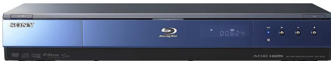
• Sony BDP-S550 met Full Profile , ethernet-aansluiting en 1GB opslag

Vanaf december 2006 zijn alle spelers Profile 1.1 en uiteraard kan je Profile 2.0 spelers herkennen aan hun aanwezige ethernet-aansluiting. Dus de kans dat je een minderwaardige Profile 1.0 speler aantreft is zeer klein.