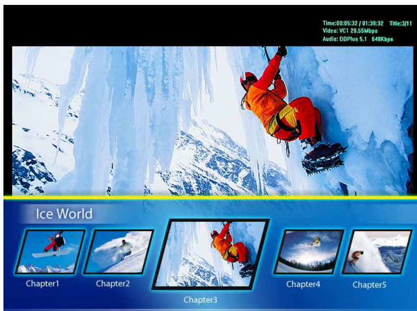
• PowerDVD Ultra in Blu-Ray weergave

Het belangrijkste is dat uw PC snel en krachtige genoeg moet zijn om Blu-Ray films te kunnen afspelen. Want het moet gezegd zijn dat aan 1920x1080 punten resolutie 50 beelden per seconden op een beeldscherm te toveren je een uitermate krachtige computer moet hebben. Sommige videokaarten kunnen uw PC wat helpen door het decoderen via de grafische kaart te doen waardoor je met een minder krachtige computer alsnog Blu-Ray of HD-DVD films op een aangename wijze kan weergeven. Maar desondanks moet je PC nog krachtig genoeg zijn om de data van de Blu-Ray schijf naar je videokaart te pompen (+27MB/s). Sommige videokaarten versnellen niet alleen je beeldweergave maar hebben een eigen sound-managment aan boord waardoor zowel beeld EN geluid door de HDMI-connector gaat. Hierdoor heb je maar 1 kabel naar je High Definition LDC TV.