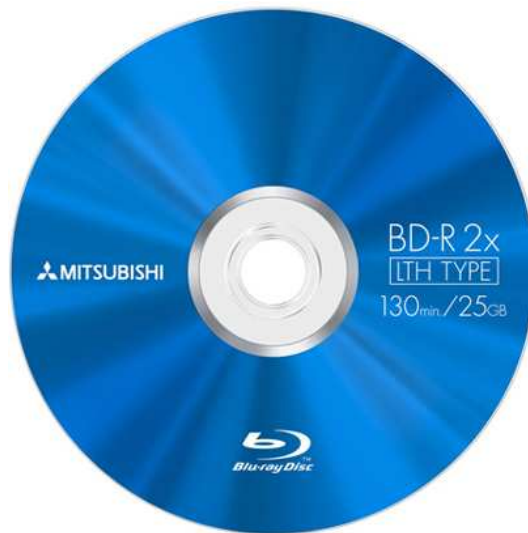
• Single layer Blu-Ray schijfje met 25GB capaciteit.

In essentie kan een Blu-Ray schijfje net zoals een DVD meer dan 1 laag bevatten. Waarbij met elke bijkomende data-laag ook de capaciteit verdubbelt. Verder bestaan er, net zoals bij DVD's, schijfjes die je terug kan wissen en opnieuw gebruiken; de zogenaamde ReWriteable schijfjes. Het onderzoek naar meer lagen per Blu-Ray schijven gaat verder en ondertussen kan men al 4-laags schijfjes maken (100GB capaciteit) of deze ook daadwerkelijk (nu al) op de markt gaan komen is nog de vraag.