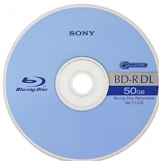
• Dual Layer Blu-Ray schijfje met 50GB capaciteit.