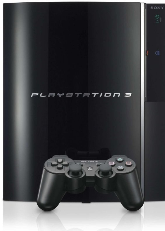
• Wellicht de bekendste Blu-Ray speler op de markt.

Na tal van tegenslagen met het octrooi op de blauwe laserdiodes werd dan eindelijk in maart 2003 de eerste Blu-Ray speler op de markt gebracht. De tegenhanger van Blu-Ray, het welbekende HD-DVD, werd pas in 2006 op de markt gebracht. Nadat HDTV ook meer verspreid geraakte zijn steeds meer en meer filmaatschappijen zich beginnen interesseren in deze media. Zowel HD-DVD als Blu-Ray maken gebruik van een blauwe laserstraal. En beiden hebben ze een enorme opslagcapaciteit. Begin 2008 kondigde Toshiba (de grondlegger van HD-DVD) aan om te stoppen met HD-DVD zodat nu vast staat dat de Blu-Ray de officiële en enige opvolger zal zijn voor DVD. De bekendste Blu-Ray speler is ongetwijfeld wel de Sony Playstation 3 welke standaard voorzien is van deze technologie.