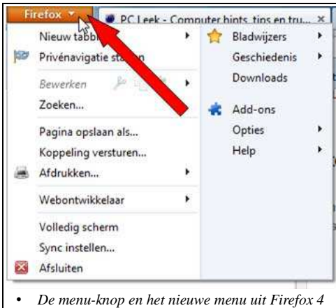
• De menu-knop en het nieuwe menu uit Firefox 4

Net zoals bij Internet Explorer valt het bijna kale uiterlijk op. In tegenstelling Internet Explorer heeft men bij Mozilla eerder naar Opera gekeken dan naar Chrome. Je hebt bovenin links een oranje Firefox-knop waarin het hoofdmenu verborgen zit. Ook dat menu ziet er anders uit dan wat we gewend zijn van Windows menu's. Doch de adres-balk ziet er ondanks de andere kleuren nog steeds hetzelfde uit. Ook je bladwijzers staan aan de rechterkant (zoals bij de vorige versie). Firefox heeft nog steeds zowel een adres-balk als een zoek-balk. Doch je kan (net zoals met de vorige versie) ook je zoekterm in de adres-balk typen zonder gebruik te maken van de aparte zoek-balk. Op de aparte zoek-balk kan je zoeken met Google, Bing, wikipedia en tal van andere zoekmachines. De belangrijkste vernieuwing (eveneens afgekeken van Opera) is Synchronisatie. Via een Firefox-account is het mogelijk om je bladwijzers, geschiedenis en wachtwoorden te delen tussen andere Firefox-browsers die je eventueel zou hebben bv. op je laptop, desktop en smartphone of tablet (ttenminste voor zover op die laatste ook Firefox staat).