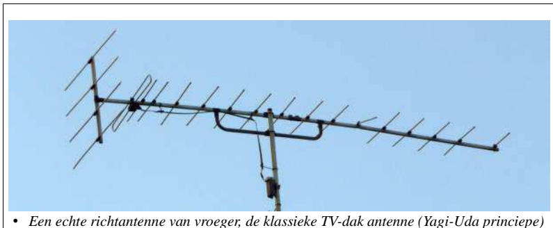
• Een echte richtantenne van vroeger, de klassieke TV-dak antenne (Yagi-Uda principe)

802.11ac antennes kunnen gebruiken maken van zogenaamde "Beamforming". Wanneer ze een idee hebben waar de router staat kunnen ze hun signaal min of meer richten en zodoende andere storingsvrije kanalen rondom uitsluiten of zelfs dat gericht signaal iets versterken. Het is nog niet helemaal hetzelfde als een echte richtantenne maar wel een goed compromis om beter signaal te hebben wanneer er weinig routers of access-points in de buurt staan (zoals thuis). Het betekent wel dat wanneer er veel access-points in de buurt staan, bv. op een beurs of conferentie, je dichterbij je access-point moet zitten om een goed signaal te hebben omdat je anders geen beamforming kan toepassen. Dus bij weinige access-points een beter signaal, bij veel access-points een slechter signaal.